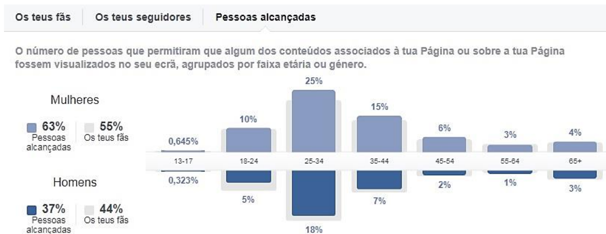
FIGURA 4- DADOS DOS FÃS QUE VISUALIZAM CONTEÚDOS DO FÓRUM MULHER NOS SEUS DISPOSITIVOS

Foram registados 580 novos visitantes da página web, a uma taxa diária de 150 visitantes por dia. Este número poderia ser maior se a página web da organização não estivesse fora do ar durante a maior parte do primeiro ano.