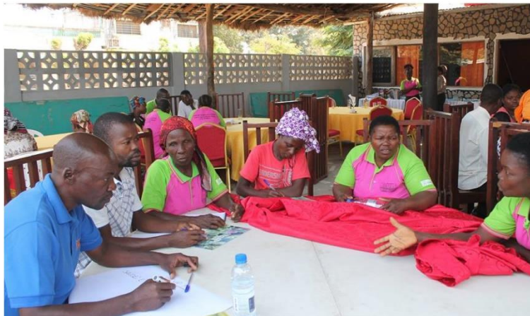
acções de consciencialização e seguimento as mulheres afectadas pela fístula obstétrica no distrito de Mocuba