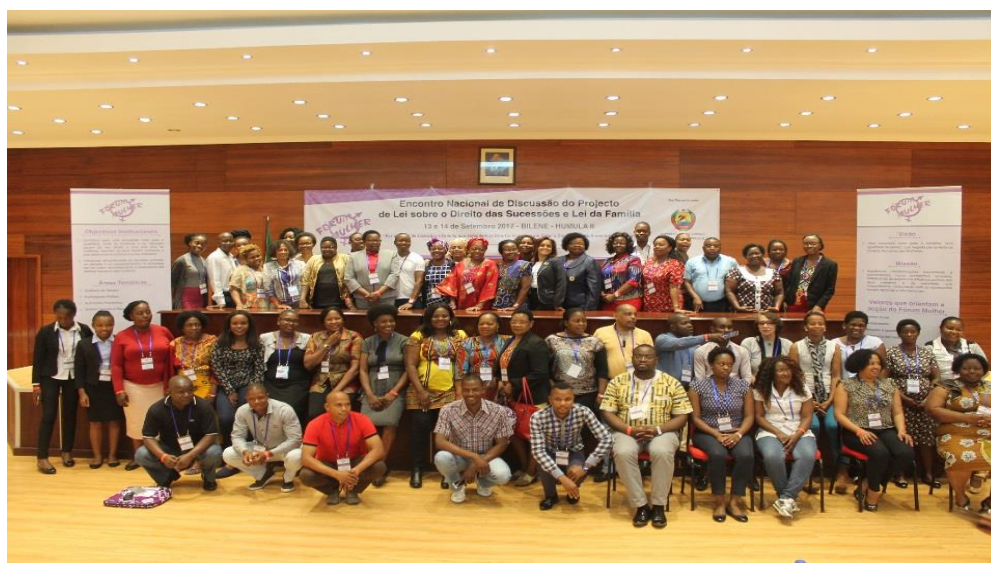
FIGURA 2: FOTOGRAFIA DAS PARTICIPANTES NO FINAL DO ENCONTRO NACIONAL SOBRE A LEI DE SUCESSÕES E LEI DA FAMÍLIA.

Geral e os Direitos das Mulheres em Particular que, de entre outras questões, discutiu a necessidade de remoção da excepção à idade núbil, da colocação do cônjuge na primeira linha de sucessíveis junto com os filhos, assegurar o reconhecimento da união de facto para efeitos de sucessão. Deste processo foram obtidos acordos importantes com a Assembleia da República com destaque para a criação de um grupo restrito de trabalho constituído pela AR e pela Sociedade Civil, liderado pelo Fórum Mulher que elaborará o documento final com os principais pontos de revisão destes instrumentos a ser submetido à AR para discussão e aprovação.