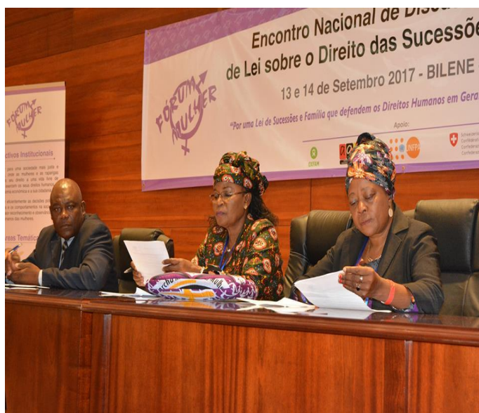
FIGURA 1: SECRETÁRIO PERMANENTE DA PROVÍNCIA DE GAZA, PRESIDENTE DA TERCEIRA COMISSÃO DA ASSEMBLEIA DA REPÚBLICA E PRESIDENTE DO CONSELHO DE DIRECÇÃO DO FÓRUM MULHER

Neste âmbito o Fórum Mulher realizou um encontro de reflexão sobre a Lei da Família e Projecto de Lei das Sucessões com deputados da Assembleia da República e organizações da Sociedade Civil, Magistrados do Ministério Público e Judicial, sob o lema Por uma Lei de Sucessões e Família que defendam os Direitos Humanos em