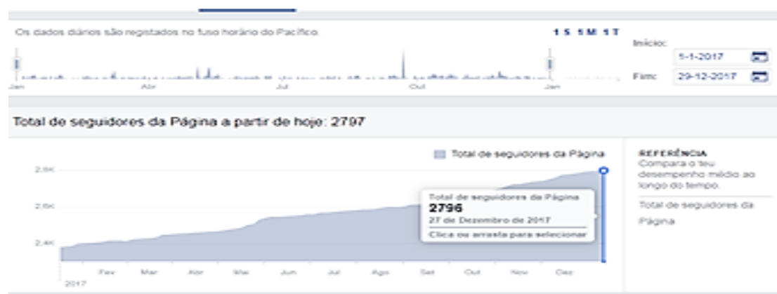
FIGURA 3- DADOS DE SEGUIDORES DA PÁGINA FACEBOOK DO FÓRUM MULHER

As redes sociais têm vindo a ganhar um espaço incontornável para as organizações que pretendem alcançar maior público exposto a informação e conteúdos por si produzidos. Reconhecendo o poder das redes sociais e da internet, o Fórum Mulher criou uma página no Facebook que tem sido um vector muito importante na partilha de informação com os membros, parceiros e com o público em geral. Com o aumento do número de seguidores e de visualizações, a página tem sido uma grande prova da quantidade de pessoas que buscam informações e se alimentam dos conteúdos partilhados pelo Fórum Mulher. De Janeiro a Dezembro o número de seguidores subiu de 2379 para 2796 representando um incremento de 17,5%, sendo que a taxa mais alta dos seguidores é de mulheres, conforme mostra o gráfico número 1. No mesmo período, o número de «Gostos» na página subiu de 2440 para 2819. O tempo de resposta actual é de 6 minutos, o que demonstra que o Fórum Mulher tem estado presente para interação com o público.