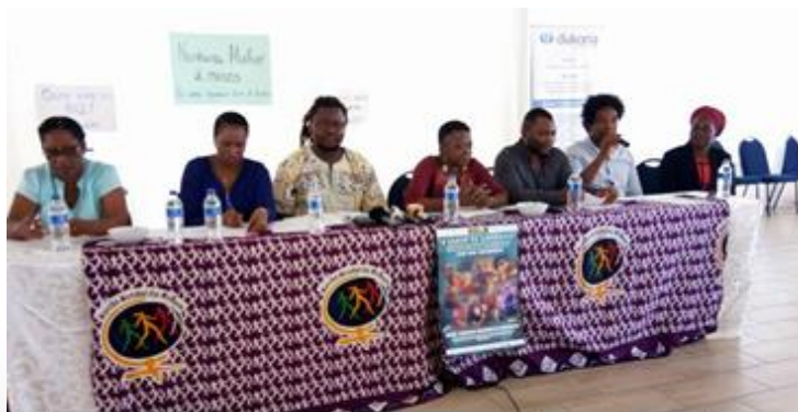
debate sobre a violência contra as mulheres com artistas

Ampliado o debate sobre a violência contra as mulheres no meio artístico (músicos, artistas plástico, poetas, cineastas, etc..) e aumentada a consciência sobre a temática levou a que muitos artistas assumissem a agenda de violência e incorporassem mensagens contra a violência nos seus trabalhos. Muitos