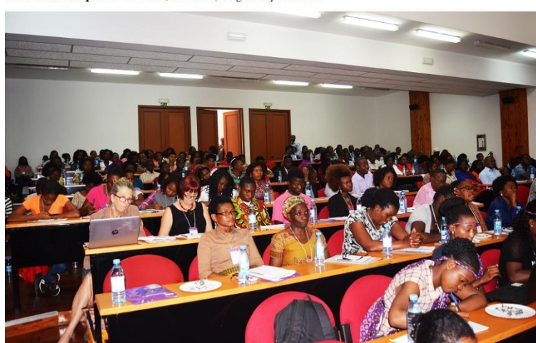
Fórum Municipal de Género, Cultura, Segurança urbana

Sociedade Civil, incluindo representantes das instituições do governo e das organizações internacionais. Contou igualmente com a presença da vice-ministra de Cooperação Internacional do Canadá. O evento serviu para aproximar os servidores públicos das prioridades das raparigas e das mulheres na gestão quotidiana, com enfoque para os bairros peri urbanos onde a insegurança é uma preocupação constante, que condiciona a vida de mulheres jovens e raparigas. A violência no namoro foi apontada como uma preocupação que necessita de atenção especial a nível das famílias e da escola.. O Fórum Municipal trouxe a partilha de diferentes iniciativas que estão a ser desenvolvidas a nível do país como alternativas para gerar mais oportunidades para as mulheres e raparigas. Como exemplo a apresentação feita pela TV SURDO que é uma plataforma de televisão voltada para a produção de informação com foco na pessoa com deficiência, em especial os surdos e os mudos. Esta engloba um grupo de profissionais com deficiência (cegos, surdos e pessoas com deficiência física).