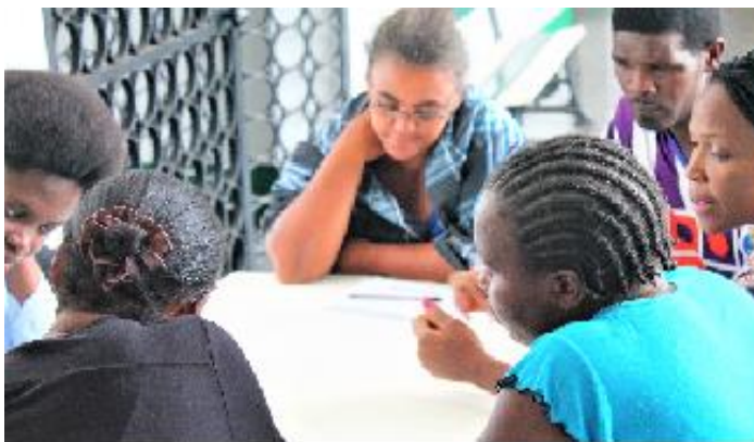
Membros do núcleo de associações femininas de Inhambane em trabalho de grupo durante a assistência técnica em M&A

Iniciado em 2014, este processo tem objectivo fortalecer a capacidade das organizações e da rede nesta componente. Este processo tem servido sobretudo para muitas organizações pensarem e reflectirem sobre suas práticas e sistemas de M&A sobretudo para questões relacionadas com o registro e reporte das ações realizadas. Realizada com maior enfoque nas províncias que beneficiam de subvenções, nomeadamente Tete, Inhambane e Nampula, este processo também foi realizado nas províncias da Zambézia, Cabo delgado e Maputo. Como resultado deste processo em Inhambane, Tete e Nampula foram elaborados planos orientados para resultados o que permitiu as organizações a melhor identificar as melhores estratégias de intervenção. Foram ainda elaborados e estão em uso nessas províncias fichas de recolha de dados e reportagem o que ajudou a melhorar a qualidade dos relatórios enviados por essas províncias ao gabinete e aos seus parceiros. Um exemplo claro dessa melhoria e a inclusão de depoimentos e histórias de mudanças nos relatórios do Nafet e Já e possível visualizar mudanças e histórias de sucesso nos relatórios da VUNEKA.