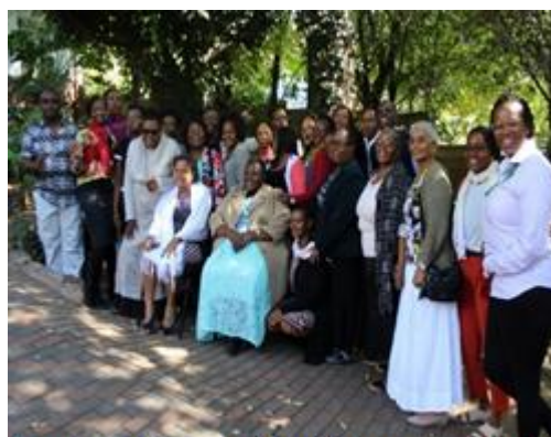
Membros do Management Board Aliança e Género da SADC

Neste âmbito a Aliança lançou em 2015 uma campanha para a adoção de um Protocolo de Género da SADC pós 2015, alinhadas com os Objetivos de Desenvolvimento Sustentável (SDGs) que incluía a proposta de moçambique sobre a inclusão de metas e indicadores sobre a prevenção e combate aos casamentos prematuros, bem como as mudanças climática. Em Agosto de 2016, os Chefes de Estado da SADC adotaram o Protocolo de Género da SADC Pós-2015, alinhado aos SDGs, Pequim + Vinte e Agenda Africana 2063. Embora o Protocolo revogado ceda todas as referências a prazos específicos, ele será acompanhado por um Monitoramento, que inclui as metas e os indicadores de género dos SDGs, que devem ser alcançados até 2030.