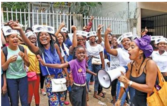
Acção pública contra maxi saias em frente a escola Secundaria Francisco Manyanga

Na sequência desta acção, cinco colegas foram detidas pela polícia da república de Moçambique sob alegação de manifestação ilegal.