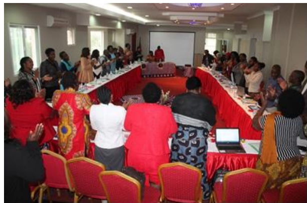
22ª assembleia de membros

Foi ainda realizada da 22ª assembleia de membros que aprovou o desempenho do ano anterior e plano de actividades e orçamento para o presente ano. Esta Assembleia admitiu ainda dois novos membros, nomeadamente: Fundação Apoio Amigo –FAA sediada em Tete e o Fórum das Organizações Femininas do Niassa-FOFEN. Acreditamos que estas organizações irão contribuir para o fortalecimento da rede potenciando as outras na sua área de expertise e elevar a qualidade de advocacia para avanço dos direitos das mulheres.